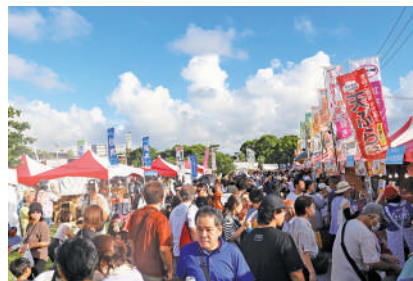
ありんくりん市会場風景

10月25日(金)～27日(日)の3日間、第27回商工会特産品フェア「ありんくりん市」が奥武山公園で開催されました。出展小間数は昨年より19小間増加し、97小間(内4小間は受賞ブース)、出展事業所も110事業所となりました。