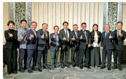
受賞祝賀会 受賞者の皆さん