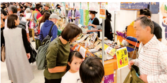
ニッポン全国物産展の様子

11月15日(金)～17日(日)の3日間、東京都池袋サンシャインシティにて、47都道府県の特産品やグルメを集めた「ニッポン全国物産展」が開催され、3日間で約8万人の集客がありました(昨年度は約7.3万人)。沖縄県からは10事業者が出展し、沖縄そば、泡盛等の様々な特産品を紹介。各事業者とも工夫を凝らして、自社商品のPRを行いました。