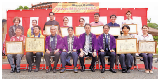
特産品コンテスト受賞者の皆さま

会期中の初日は雨のち曇り、残り2日間は晴天に恵まれ、主催者発表で会期中27万人もの方々が来場され、売上高は約5,300万円となりました。また、「ありんくりん市」開催に向けて、事前にSNS活用セミナー等を開催し、出店事業者の情報発信支援を行いました。