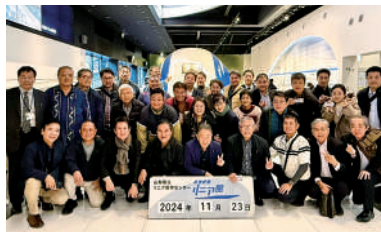
山梨県立リニア見学センター