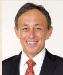
沖縄県知事 玉城 デニー