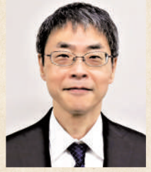
内閣府沖縄総合事務局 局長 三浦 健太郎