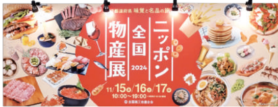
ニッポン全国物産展看板